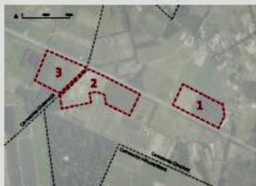
Nieuw voorstel Zonneparken