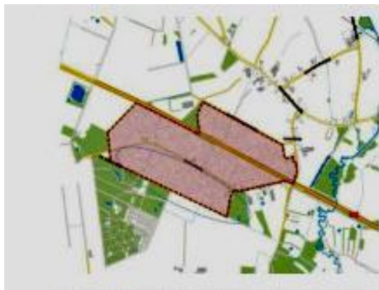
Zoekgebied gemeente Oirschot