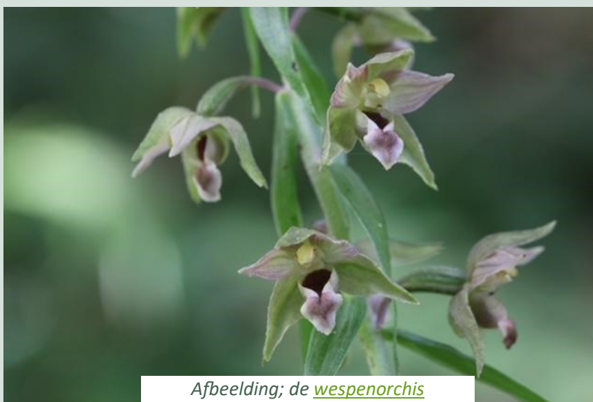
Afbeelding; de wespenorchis

Langs de Bosweg is het eerste positieve resultaat al te zien. Veldzuring, een kensoort van schralere hooilanden is tot bloei en zaadvorming gekomen en de breedbladige wespenorchissen kunnen nu ongestoord tot bloei komen..