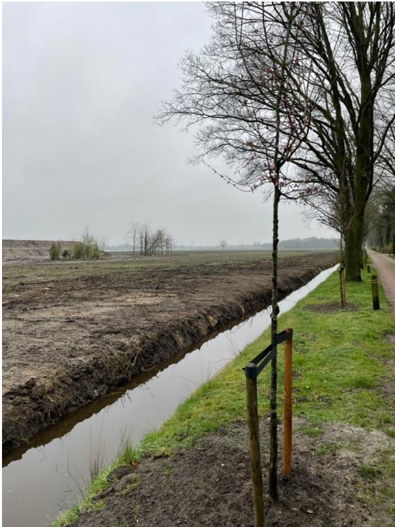
Jonge aanplant van een zestal Prunussen op de Berkenlaan

Als bewoner kunt u te allen tijde een onderwerp ter bespreking voorleggen aan deze Bewonersraad door te mailen naar bewonersraad@stillewillewonen.nl